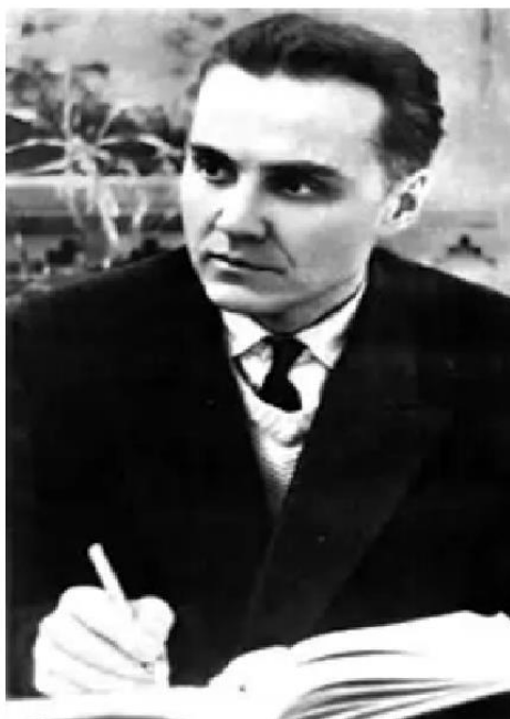
В. А. СУХОМЛИНСКИЙ